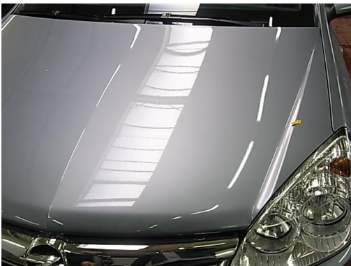
2. Motorhaube Dellen smartrepair

Hierbei handelt es sich um kein technisches Funktionsprotokoll bzw. -gutachten.