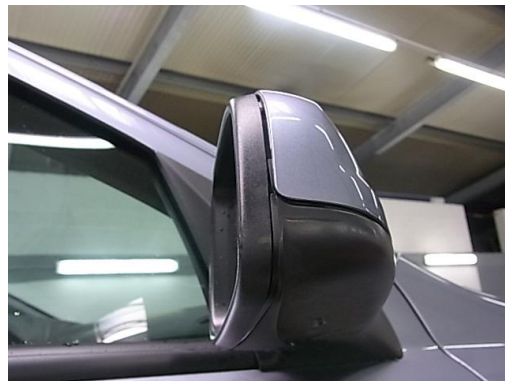
5. Seitenspiegel rechts Gehäuse beschädigt